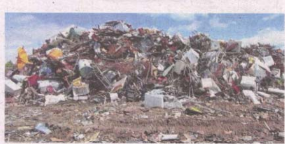
KIRA-KIRA 3,000 tan metrik sisa pepejal mampu diproses dalam sehari apabila loji insinerator di Jeram, Selangor siap pada 2024.