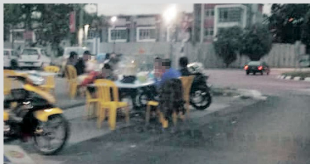
Menjamu selera di tepi jalan tidak menjamin keselamatan pelanggan restoran berkenaan.