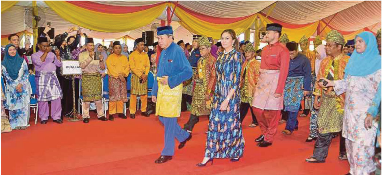
Sultan of Selangor Sultan Sharafuddin Idris Shah arriving at the royal tea ceremony in conjunction with his 73rd birthday at Istana Alam Shah in Klang yesterday. With him are Tengku Permaisuri of Selangor Tengku Permaisuri Norashikin and Raja Muda of Selangor Tengku Amir Shah.