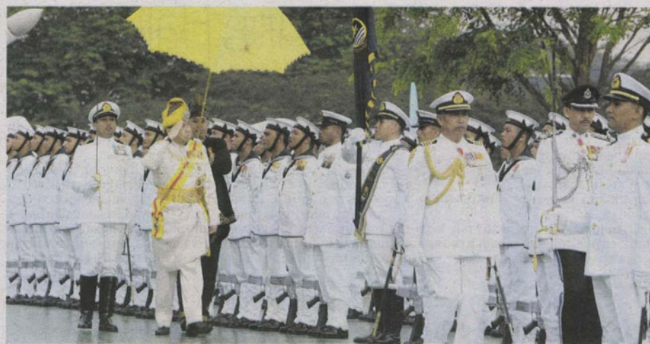
SULTAN SHARAFUDDIN IDRIS SHAH memeriksa perbarisan sempena Istiadat Penganugerahan dan Pengurniaan Darjah dan Bintang Kebesaran Negeri Selangor sempena menyambut Ulang Tahun Hari Keputeraan Ke-73 baginda di Istana Alam Shah, Klang, Selangor semalam.