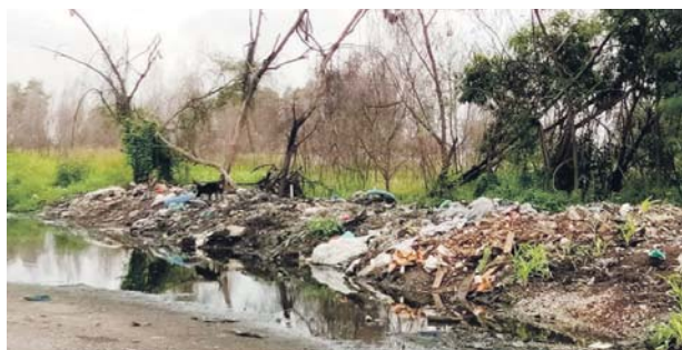
Anjing liar berkeliaran di kawasan sampah dan membimbangkan penduduk.