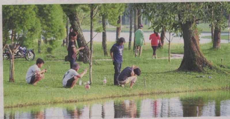
The park and lake provide a serene place for Kota Kemuning residents to unwind.

Kota Kemuning residents take to Facebook to oppose planned hypermarket in their neighbourhood