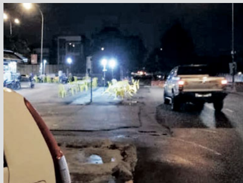
Penduduk membantah pengusaha restoran meletakkan meja dan kerusi di bahu jalan raya.

"Kita juga tidak mahu kejadian kenderaan merempuh pelanggan yang sedang menikmati juadah," katanya.