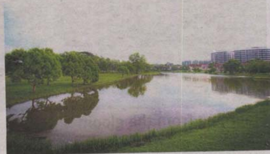
The proposed hypermarket will be built on a 0.8ha plot of land next to the Kota Kemuning lake.