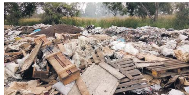
Kayu dan sampah sisa industri turut dibuang di kawasan 300 meter dari perumahan.