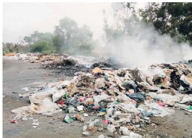
Kawasan pembuangan sampah kini sebesar padang bola sepak.

Menurutnya, individu tidak bertanggungjawab itu semakin kerap membuang sampah walaupun penduduk