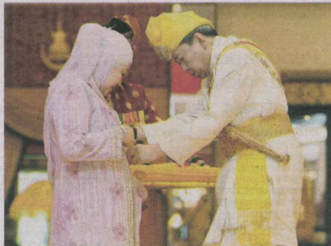
SULTAN SHARAFUDDIN IDRIS SHAH menganugerahkan Darjah Kerabat Selangor Yang Amat Dihormati (DK II) kepada Tengku Puteri Nor Zehan Almarhum Sultan Salahuddin Abdul Aziz Shah Alhaj di Balairung Seri Istana Alam Shah, Klang, Selangor semalam.