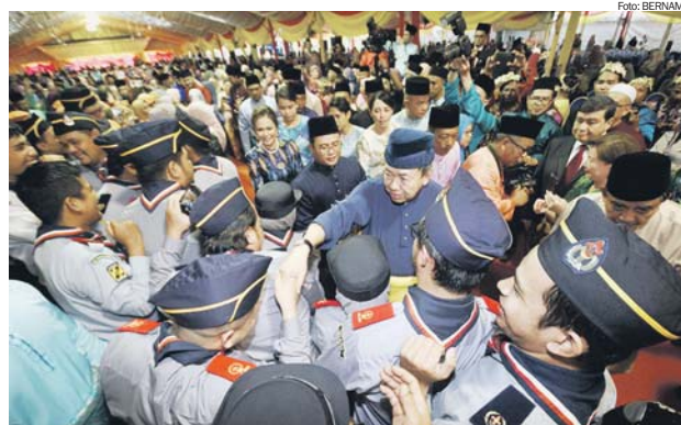
Sultan Sharafuddin dan Tengku Norashikin berkenan bersalaman dengan tetamu pada Majlis Jamuan Teh Di Raja di Padang Mahkota Istana Alam Shah, semalam.

Turut berangkat, Tengku Permaisuri Selangor, Tengku Permaisuri Norashikin dan Raja Muda Selangor, Tengku Amir Shah.