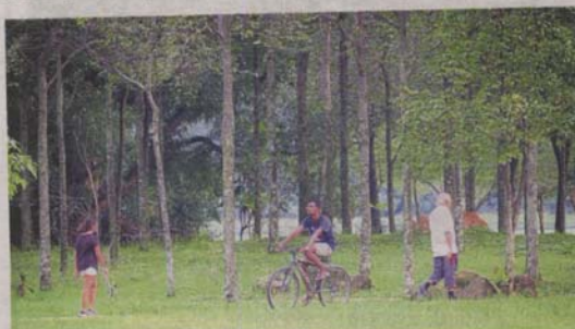
Kota Kemuning residents are using Facebook to lobby against the proposed development of a hypermarket next to this park.

"Vendors can use it at night and the public can utilise the area during the day," he said.