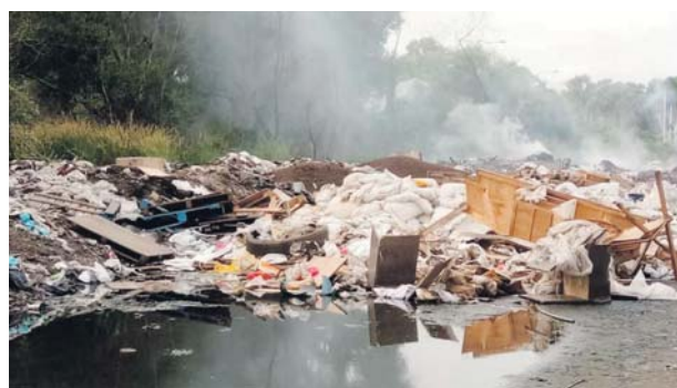
Longgokan sampah menakung air dan menjadi tempat pembiakan nyamuk aedes.